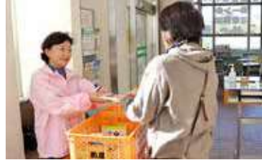
食材を受取る女性部支所部長

各支所にてフードドライブを実施！ 各支所でフードドライブを実施し、支所内に設置したボックスへの寄付を呼びかけ、食品124kg、米172kgの食材が集まりました。 フードドライブとは、ご家庭で眠っている食べきれない食品を持ちより、必要としている方に寄付する活動のことであり、JA粕屋女性部が企画課と連携して実施したものです。 集められた食品は、賞味期限の確認を行ったのち、品目別に仕分けられ、3月4日粕屋管内の子ども食堂へ寄贈する予定にしています。