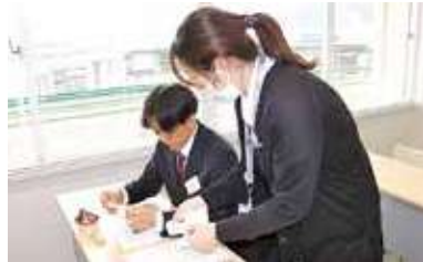
新入職員に紙幣の数え方を指導する本所管理課職員

新入職員研修会開催 4月より入組予定の新入職員に研修を実施しました。スリッパに身を包んだ新入職員12名が希望を胸に、JA職員としての自覚と仕事を円滑にすすめるための必要な基礎知識を学びました。3月13日の金融業務の研修では、紙幣を数える作業に四苦八苦していましたが、上手に扇状に広げることが出来ず、あちらこちらから「どうしたら綺麗に広げられますか」との声があがり、紙幣の数え方を実演する先輩職員の手元を食い入るように見ていました。指導した先輩職員は「一日も早く一人前のJA職員になれるように頑張ってください」と話していました。