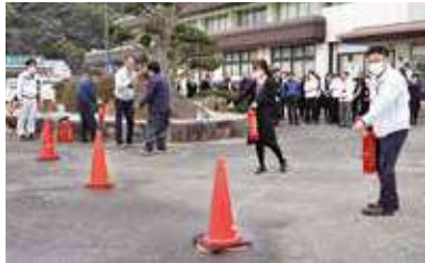
初期消火訓練を行う本所職員

JA粕屋本所で火事を想定した避難訓練実施 本所で、火災の迅速かつ適切な通報及び初期消火技術の向上を目的として避難訓練を行いました。 当日は火災の発見から通報、初期消火から避難誘導まで一連の避難訓練を展開しました。参加した職員は「今回の訓練を通じて、初動動作の大切さ、災害発生箇所の確認、迅速な誘導など一分一秒の適切な判断の大切さが分かった。 この経験を活かし、火災や災害が発生した時は迅速かつ適切に行動したい」と話していました。