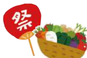
【「農業まつり」の実施】