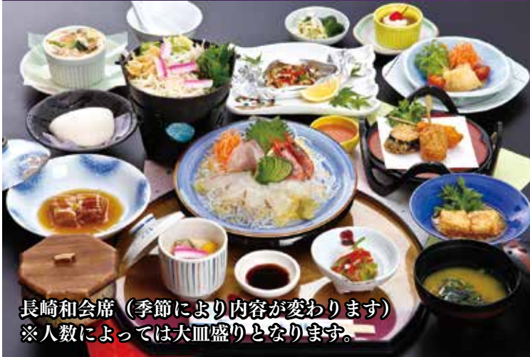
長崎和会席（季節により内容が変わります） ※人数によっては大皿盛りとなります。