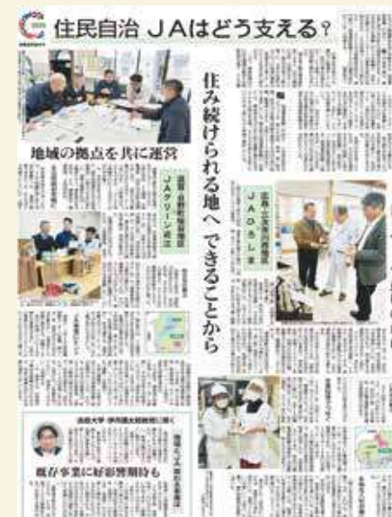
日本農業新聞 令和7年3月15日

JA粕屋では、管内地域活動強化のため、令和7年度（2025年度）より営農経済部に「地域ふれあい課」を設置し、農作業受託事業の一環として農業支援や、農園事業と連携した新規就農者支援、支所運営委員会活動の強化、地元産農産物の直売会など都市型農業を十分に活かした取り組みを行い、地域農業振興に務めてまいります。そして、JA粕屋は、組合員、地域の皆さまから「かけがえのない存在」と認識していただけるよう取り組んでいきます。