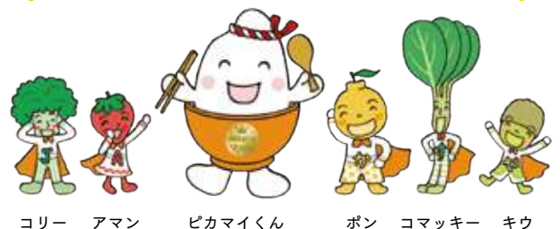
コリー アマン ピカマイくん ポン コマッキー キウ