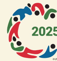
国際協同組合年 協同組合はよりよい世界を築きます

今回の特集は、2回目となる「国際協同組合年」のねらいと、その中で、JAが地域にどう貢献できるか、JAの果たす役割について報告します。