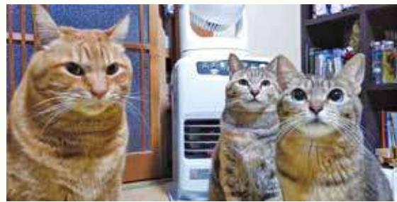
茶トラ猫「ゆう」、麦わら猫「バニラ」、キジトラ猫「こまめ」