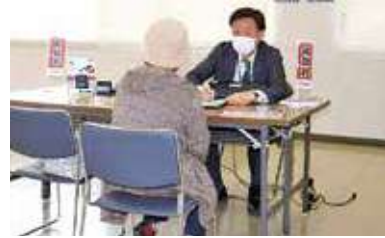
聞こえの相談会開催の様子

聞こえの相談会開催 管内11支所において補聴器の聞こえに関する相談会を開催しました。今回の相談会はJA粕屋経済課が福祉医療器を協賛メーカーとして、毎年開催しています。 担当したフジ医療器メーカー営業担当者は、「加齢性難聴は、聞こえが悪くなるばかりでなく、近年の研究により、認知症のリスクを高めることが明らかになってきている。難聴によって音の情報が脳にうまく入ってこなくなると、脳の活動が低下し、相手とのコミュニケーションの機会が減少し、認知機能の低下にもつながる。そのような症状が現れ始めた方は、ぜひご相談頂きたい。また、少しでも皆さんの聞こえのお役に立てる様これから精進していきたい」と話していました。