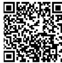
▲省エネ通知のページQRコード