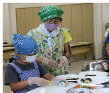
なかよく巻きずしを使って巻いたり、巻いたお寿司を切ったりしました♪