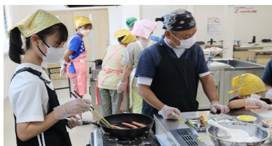
うどんを炒めます♡

参加者は「自分で初めて巻きずしを巻くのが楽しかった。」「子供と参加でき、とても良い体験ができました。」と大好評でした。巻きずし・いなりずしの他に、粕屋産野菜を使ったポテトサラダ・お吸い物、ふくれんのつぶ入りみかんジュースを使ったつぶ入りみかんゼリーを食べました。親子食育教室は、食の安全性や粕屋産の農産物を広めていくために、今後も続けてまいります。