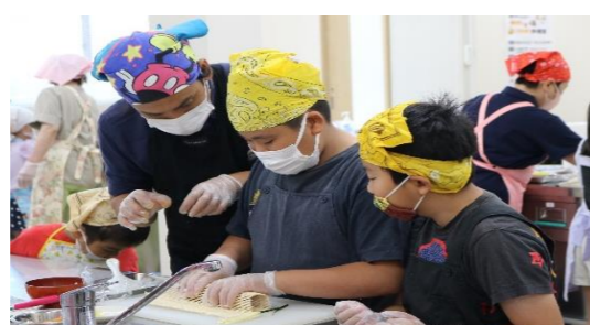
ぎゅっぎゅっ!!しっかり巻きます。