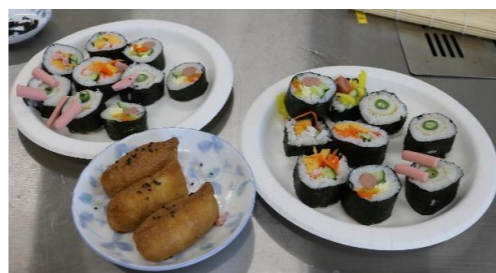
上手に出来ました♪