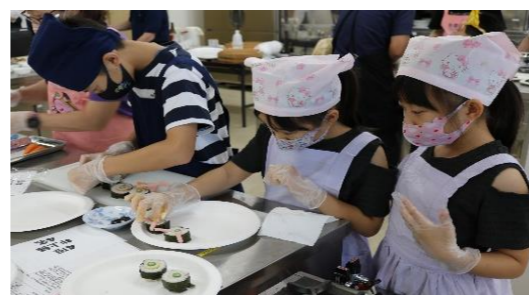
うさぎさんのお顔になるように飾ります😊